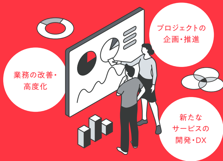
データサイエンティストの仕事