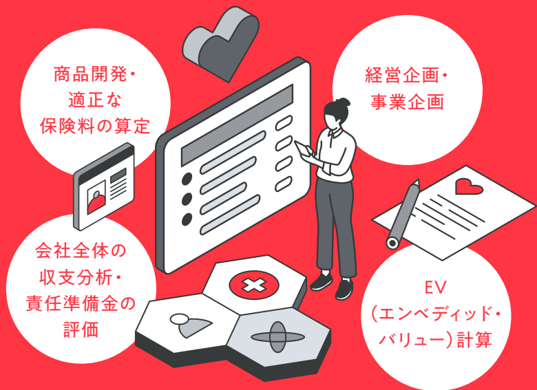
生保アクチュアリーの仕事