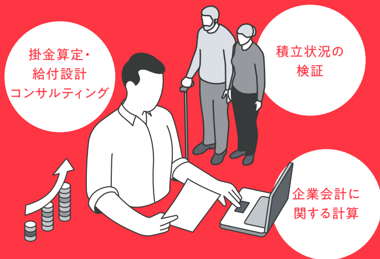
年金アクチュアリーの仕事